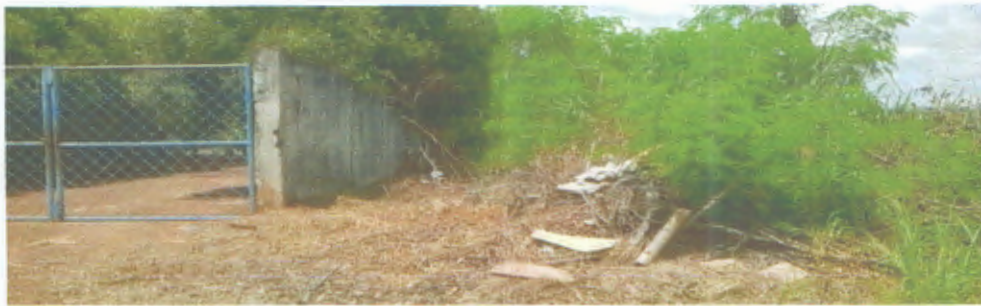
Muro da Escola Municipal Pe. Sebastião Teixeira de Carvalho, Vila Maria.

O munícipe que encaminhou as denúncias e as fotos lembra: “Abram os olhos população, pois escutamos sempre os meios de comunicação da prefeitura cobrando da população para limpar os lotes, mas limpar as vias públicas está administração não quer”.